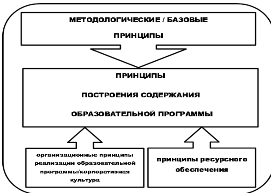
Рисунок 1. Принципы Программы ОП ДО

Методологические/Базовые принципы определены ФГОС ДО, рабочей программой воспитания (см. таблицу 3).